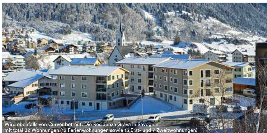
Wird ebenfalls von Curvér betreut: Die Residenza Grava in Savognin mit total 32 Wohnungen (12 Ferienwohnungen sowie 13 Erst- und 7 Zweitwohnungen)

Roman Stäbler, vielen Dank für das Gespräch.