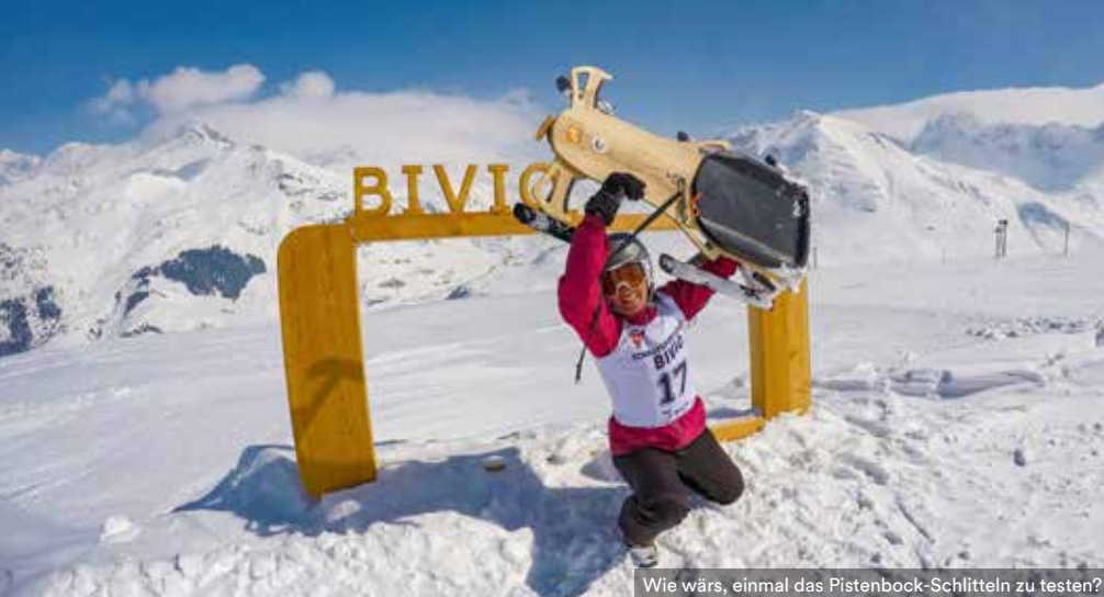
Wie wärs, einmal das Pistenbock-Schlitteln zu testen?