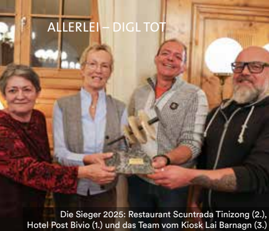
Die Sieger 2025: Restaurant Scuntrada Tinizong (2.), Hotel Post Bivio (1.) und das Team vom Kiosk Lai Barnagn (3.)