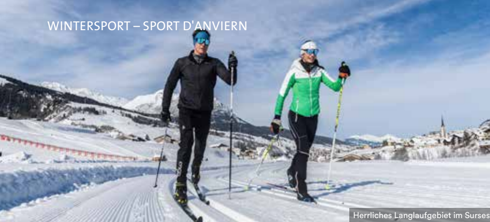
Herrliches Langlaufgebiet im Surses