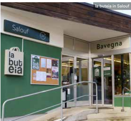
la buteia in Salouf