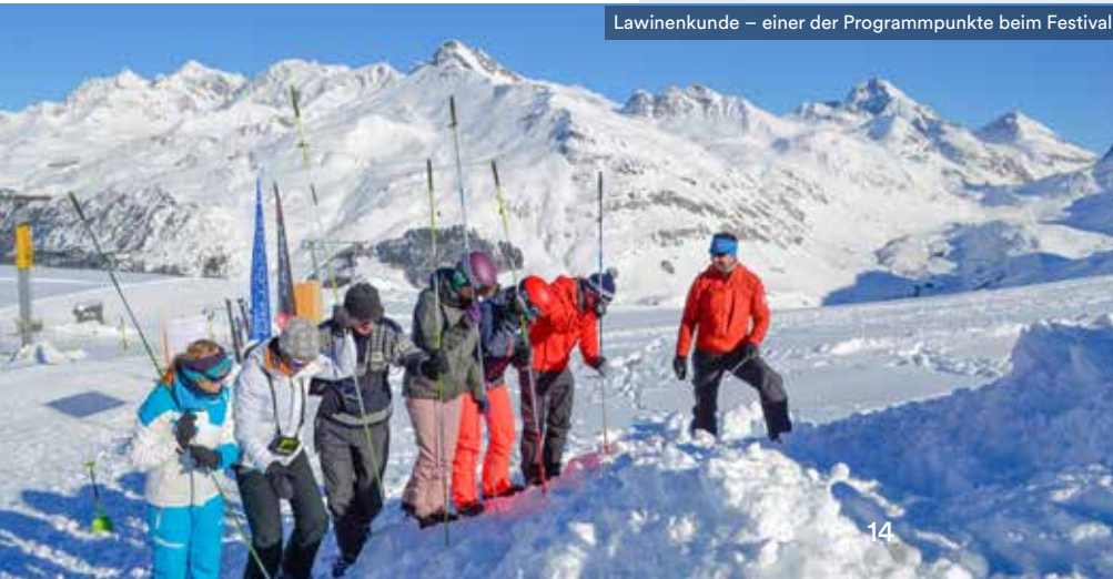
Lawinenkunde – einer der Programmpunkte beim Festival