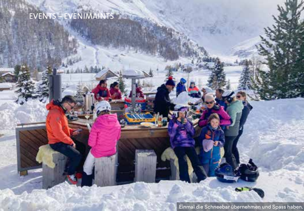
Einmal die Schneebar übernehmen und Spass haben.