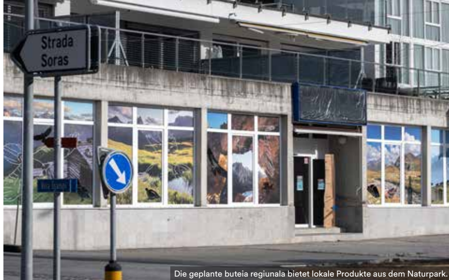
Die geplante buteia regionala bietet lokale Produkte aus dem Naturpark.