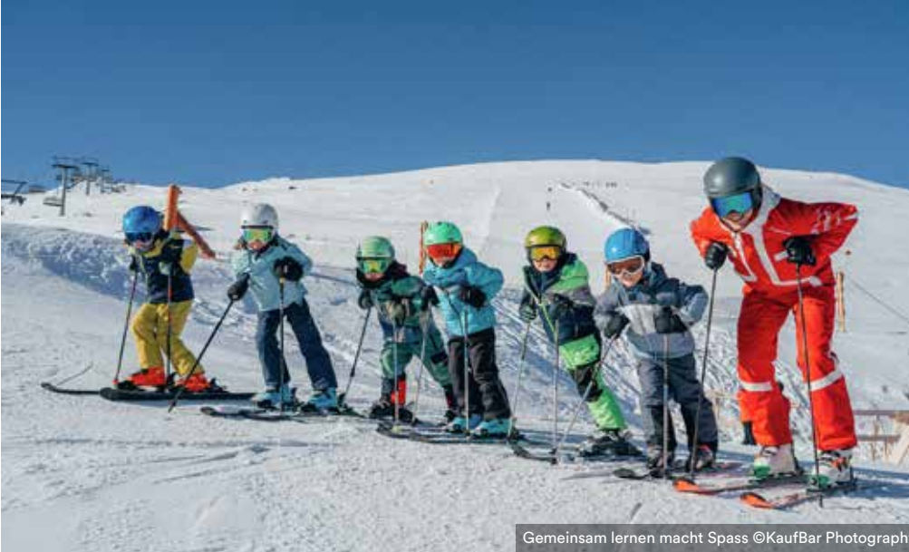
Gemeinsam lernen macht Spass