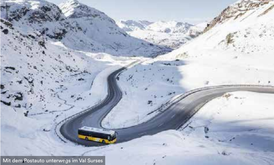
Mit dem Postauto unterwegs im Val Surses