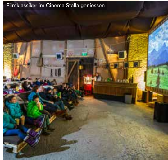
Filmklassiker im Cinema Stalla geniessen