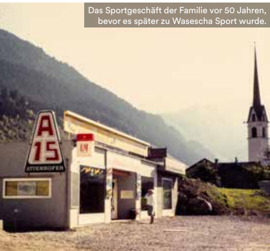
Das Sportgeschäft der Familie vor 50 Jahren, bevor es später zu Wasescha Sport wurde.

Nach kleineren Renovationsarbeiten startete die Familie Gruber am 1. Juli 2023 in der Tgesa Romana ins gemeinsame Abenteuer. Von Anfang an war klar, dass sie das Haus in absehbarer Zeit totalsanieren wollten. Der Plan war jedoch, zuerst einmal zwei Jahre