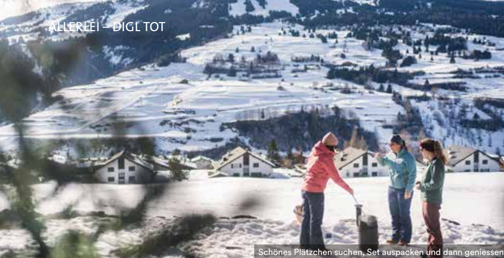
Schönes Plätzchen suchen, Set auspacken und dann geniessen