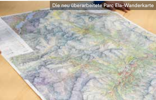
Die neu überarbeitete Parc Ela-Wanderkarte

Die Karte ist für CHF 15.00 bei den Tourismus-Infostellen und am Bahnhof Tiefencastel erhältlich.