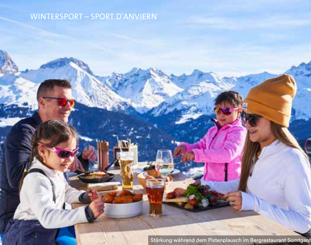
Stärkung während dem Pistenplausch im Bergrestaurant Somtgant