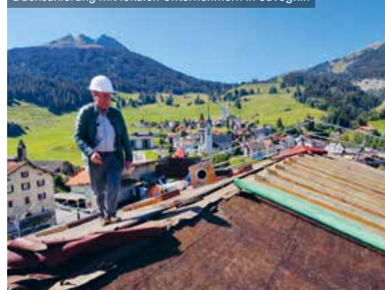
Dachsanierung mit lokalen Unternehmern in Savognin

Wichtig ist eine frühzeitige und offene Diskussion, ohne Druck auf schnelle Entscheide. Gemeinsam müssen Prioritäten gesetzt und eine realistische Planung erarbeitet werden. Bewährt hat sich auch ein Eigentümer-Ausschuss oder eine kleine Arbeitsgruppe, die Sanierungen zusammen mit der Verwaltung vorbereitet.