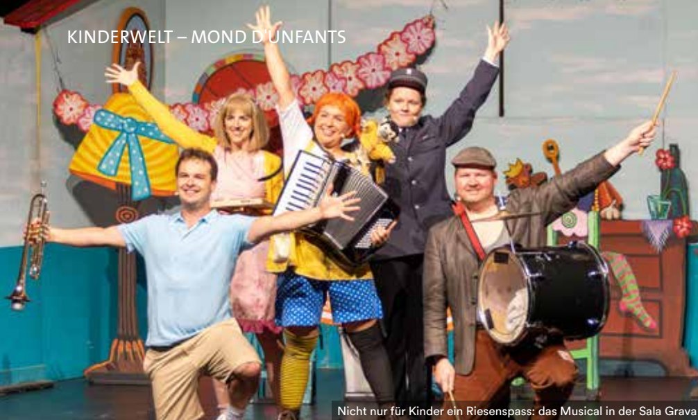
Nicht nur für Kinder ein Riesenspass: das Musical in der Sala Grava