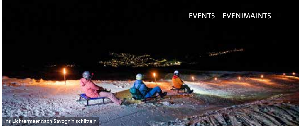
Ins Lichtermeer nach Savognin schlitteln