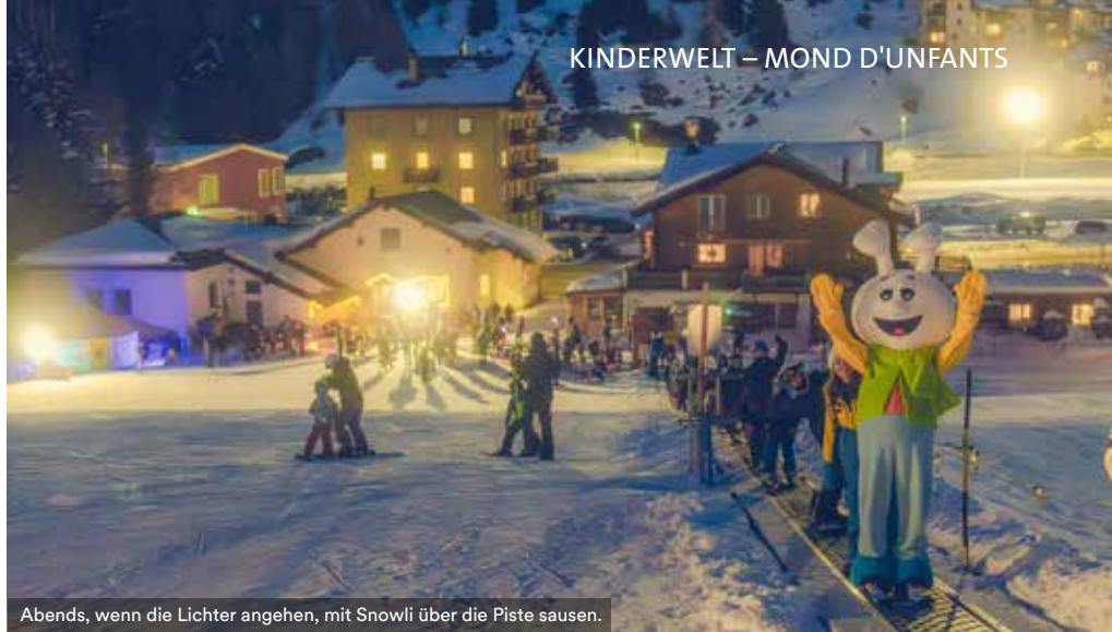
Abends, wenn die Lichter angehen, mit Snowli über die Piste sausen.