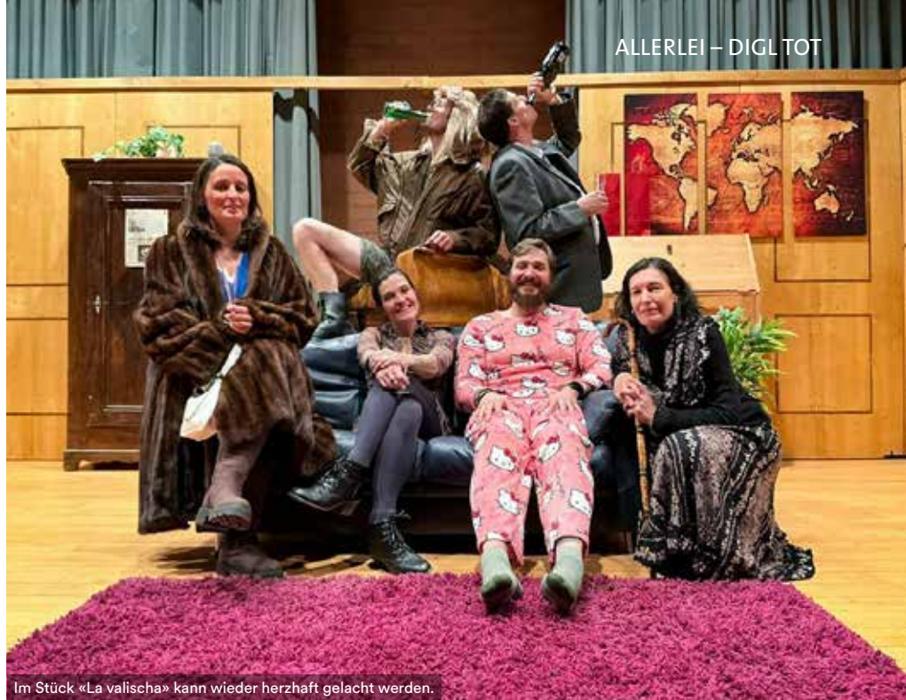
Im Stück «La valischa» kann wieder herzlich gelacht werden.

Sauna geniessen in der liebevoll gestalteten Umgebung des Tigia