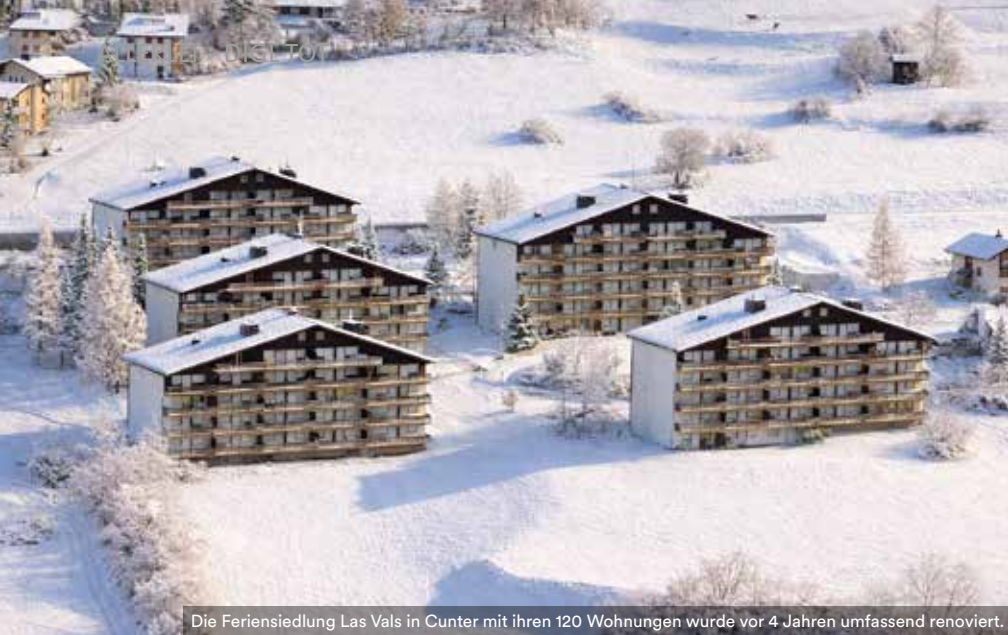
Die Ferienanlage Las Vals in Cunter mit ihren 120 Wohnungen wurde vor 4 Jahren umfassend renoviert.