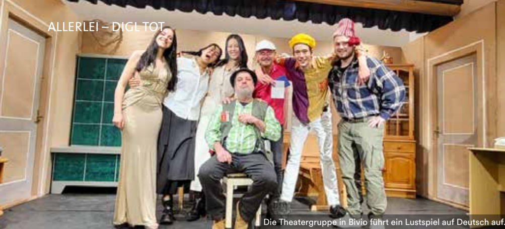
Die Theatergruppe in Bivio führt ein Lustspiel auf Deutsch auf.