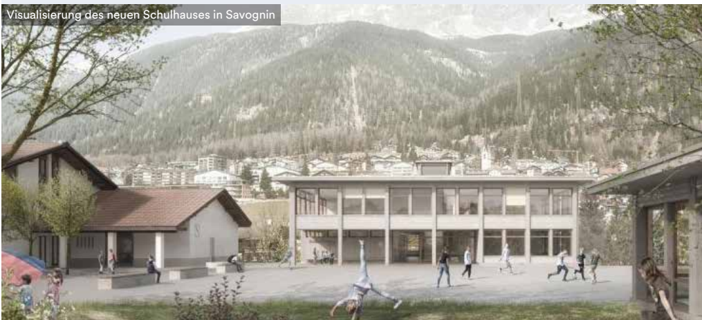
Visualisierung des neuen Schulhauses in Savognin