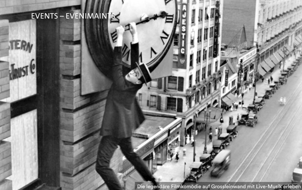
Die legendäre Filmkomödie auf Grossleinwand mit Live-Musik erleben