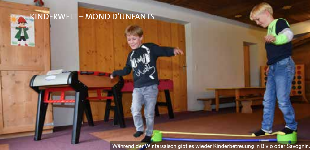
Während der Wintersaison gibt es wieder Kinderbetreuung in Bivio oder Savognin.