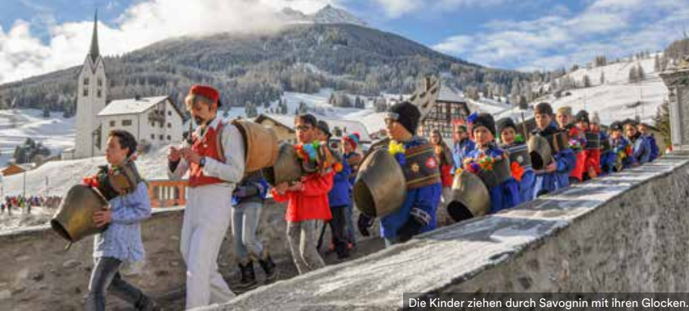
Die Kinder ziehen durch Savognin mit ihren Glocken.