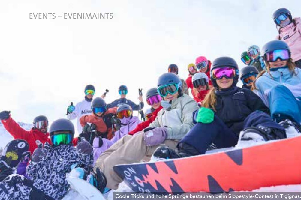
Coole Tricks und hohe Sprünge bestaunen beim Slopestyle-Contest in Tignes.