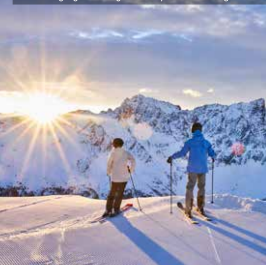
Sonnenaufgangsstimmung beim Early Bird Skifahren genießen