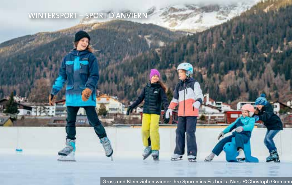
Gross und Klein ziehen wieder ihre Spuren ins Eis bei La Nars.