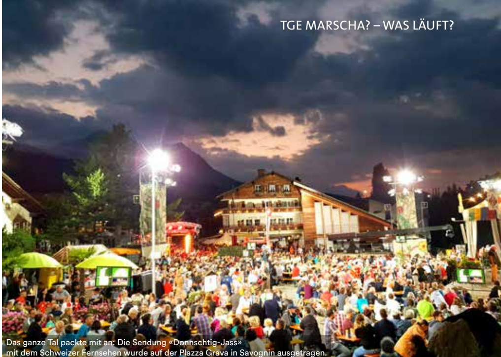
Das ganze Tal packte mit an: Die Sendung «Donnschtig-Jass» mit dem Schweizer Fernsehen wurde auf der Piazza Grava in Savognin ausgetragen.

All jene, wo man die Wirkung direkt gespürt hat: Wenn bei Anlässen die Leute Freude hatten, Kinderaugen